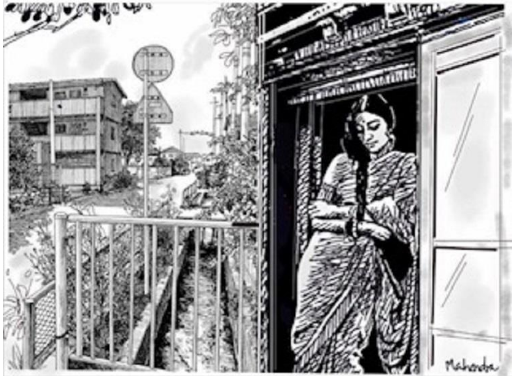
Two Artists, one Painting!