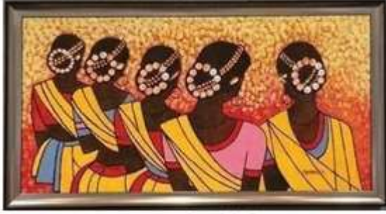
સુંદરતા ટેકાલી મેં હૈં