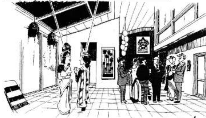
House warming party

તમારી વાત સાચી છે... પણ એક વીન્ડો જ મધ્યેને ફીટ થતી હતી ત્યાં બે ક્યાં મૂકે? બીસાઈડ્સ હપ્તા પણ જોવાના ને!!!